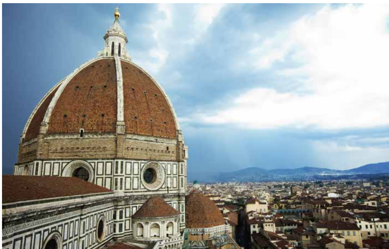
VISTA DI FIRENZE DAL DUOMO

Il prossimo settembre si terrà a Firenze la Conferenza Europea di Ingegneria Chimica (ECCE 12), in concomitanza con la conferenza Europea di Biotecnologia Applicata (ECAB 5), organizzate da AIDIC sotto gli auspici delle rispettive Federazioni Europee. European Federation of Chemical Engineering (EFCE) ed European Society of Biochemical Engineering Science (ESBES). L'EFCE rappresenta il più attivo foro dell'ingegneria chimica in Europa. Per più di sessant'anni ne è stato il riferimento sia nell'industria che nel mondo accademico, nelle sue diverse discipline, favorendo proficue collaborazioni nel campo dell'innovazione e della ricerca applicata.